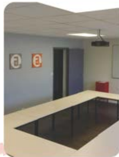
la salle équipée

Tous possèdent le matériel nécessaire à la bonne acquisition de chacun, complété par des ressources techniques professionnelles.