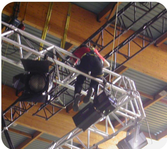
Prévention des risques / Sécurité