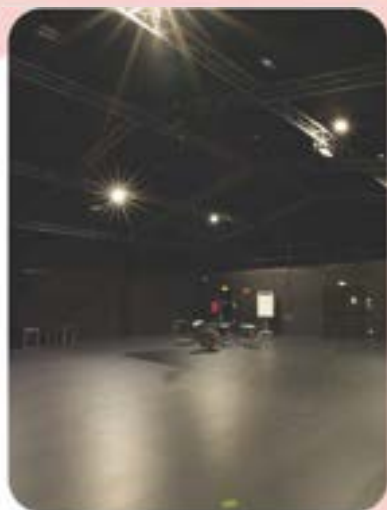
le plateau de création