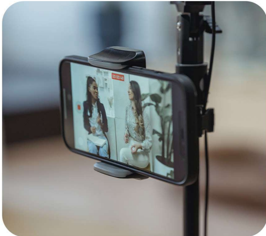
Audiovisuel / Cinéma