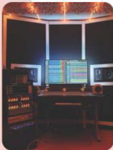
le studio d'enregistrement